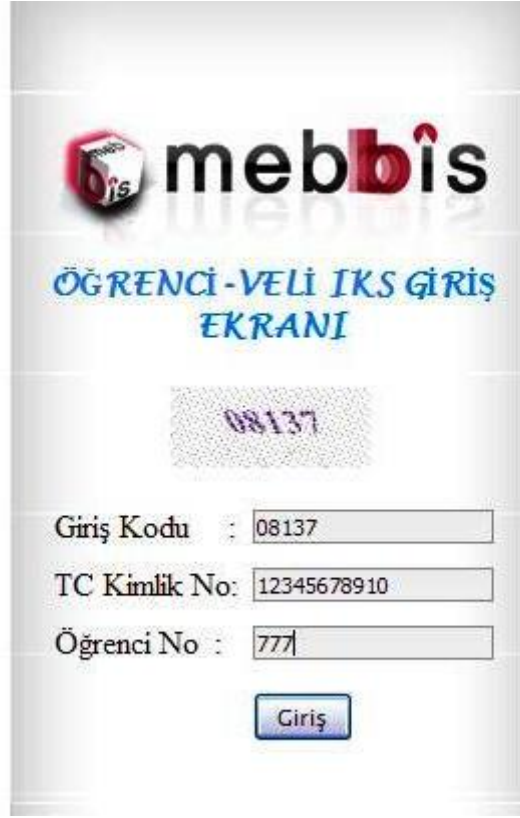
Şekil - 3

5. Gelen ekranda Şekil-3'teki gibi "Giriş Kodu", "TC Kimlik No" ve "Öğrencinin Okul Numarasını" yazıp "Giriş" butonuna tıklıyoruz. Veli kendi TC Kimlik Numarasını yazacaktır.