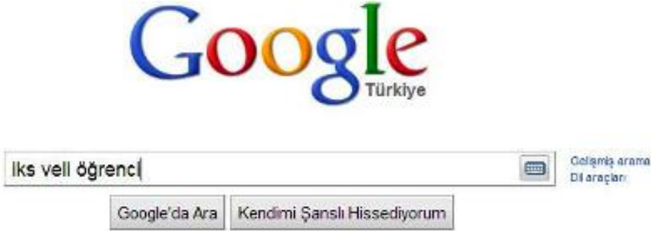
Şekil – 1