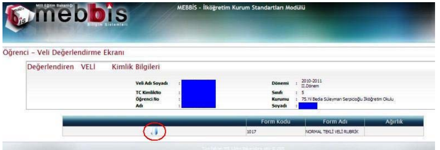
Şekil - 4

6. Karşımıza "Değerlendiren Veli Kimlik Bilgileri" ekranı gelecektir. (Şekil-4) Bu ekranda Şekil-4'te kırmızı çember içine alınmış simgeye tıklıyoruz.